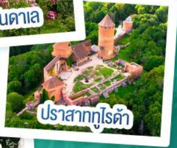
ปราสาทกูไรต้า