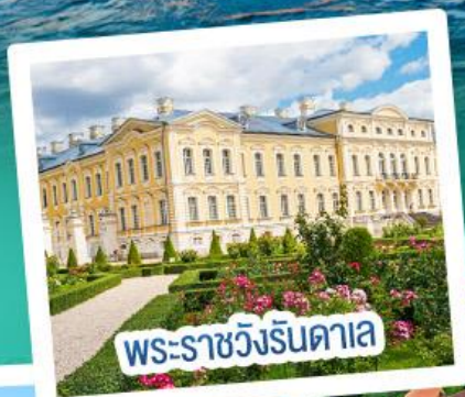
พระราชวังรินดาเล