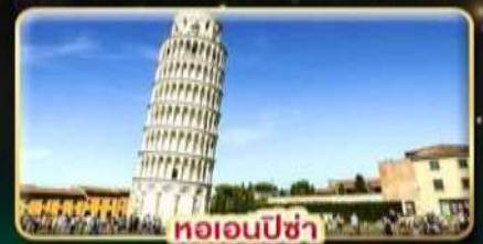
หออนปีซ่า