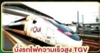
นั่งรถไฟความเร็วสูง TGV