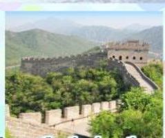
กำแพงเมืองจีน ด้านจวิยงทง