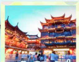
ตลาดร้อยปีเฉิงหวังเมี่ยว