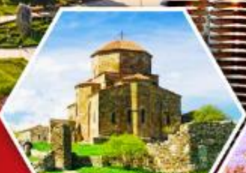
วิหารกอรี