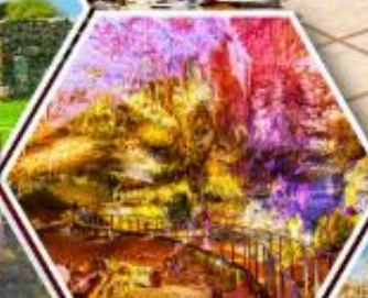
น้ำพอร์บิธีอุส