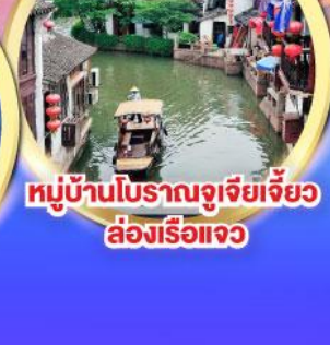
หมู่บ้านโบราณจูเจียเจี้ยว ล่องเรือแจว