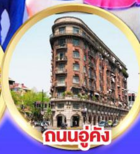
ถนนอู่คัง