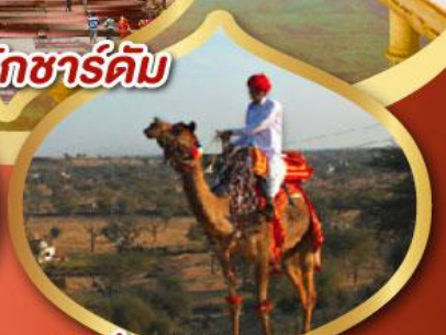
ฟรี ขี่อูฐ เมืองมันทาวา ราคาเริ่มต้น