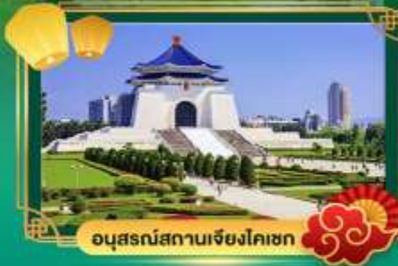
อนุสรณ์สถานเจียงไคเชก