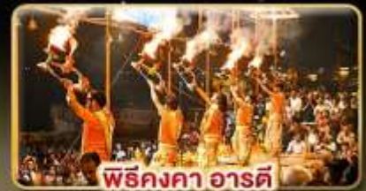
พิธีคงคา อารดี