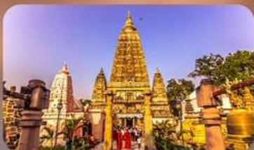
วัดมหาโพธิ์