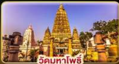
วัดมหาโพธิ์