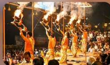
พิธีสงคา อารตี