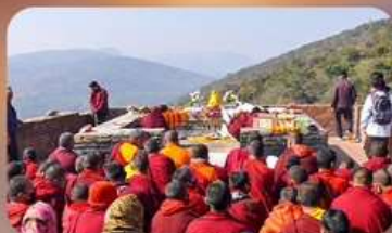
เขาคิชฌกูฏ