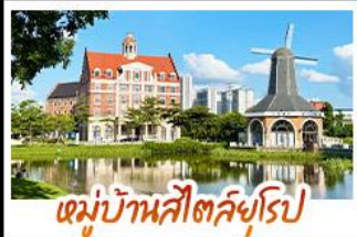
หมู่บ้านสโตร์ยุโรป

ล่องเรือชมดอกไม้สีขาวบานเหนือสายน้ำ ณ เมืองคูอินเสียงส่าย หนึ่งในปีหนึ่งครั้ง ถ่ายรูปเช็คอินแบบชิคๆ ณ หมู่บ้านสโตร์ยุโรป • ชม UNSEEN แห่งป่าหม่า ล่องเรือชมทะเลในท่า ณ ซันเหมินไห่ เหมือนแคสเคดสวรรค์ • ชมน้ำพุร้อนฟ้า ที่ท่องเที่ยวระดับ 4A • ชมความอลังการของ น้ำตกสองแผ่นดิน จีน-เวียดนาม ณ เต๋อเทียน • ทำน้ำแข็งหลอดกับประติมากรรมน้ำแข็งสวยงาม และอากาศดีดล • ชมดอกไม้ตามฤดูกาล ณ เวาซิงชิว พร้อมขอพรเจ้าแม่กวนอิมพันก