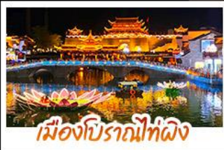
เมืองโบราณที่ผิง