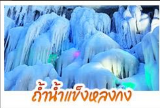
ถ้ำน้ำแข็งหลงกง