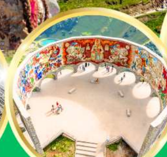
Russian-Georgian Friendship Monument