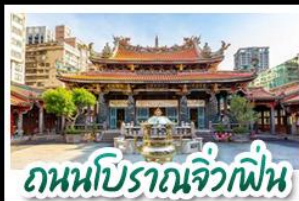
ถนนโบราณจิวเฟิ่น

ทะเลสาบสุริยันจันทรา - ล่องเรือชมวิว - จิวเฟิ่น สือเฟิ่น - TAIPEI 101- ชีเหมินตง หนานโถว 1 คืน ไทเป 2 คืน