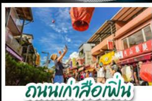
ถนนเก่าสือเฟิ่น