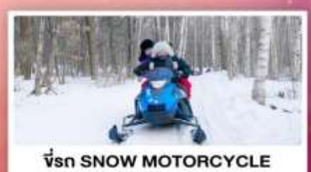
ขี่รถ SNOW MOTORCYCLE