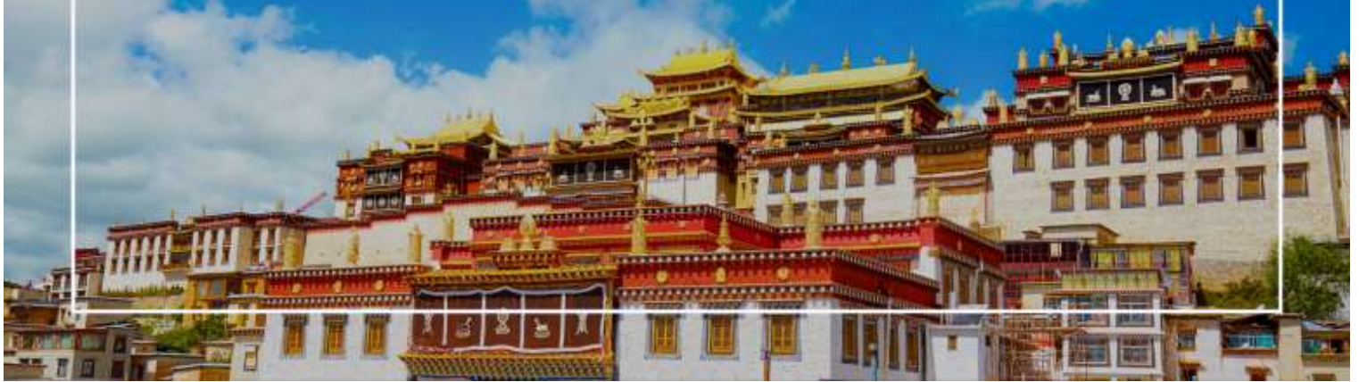
วัดชงจ้านหลิง (Songzanlin Monastery)