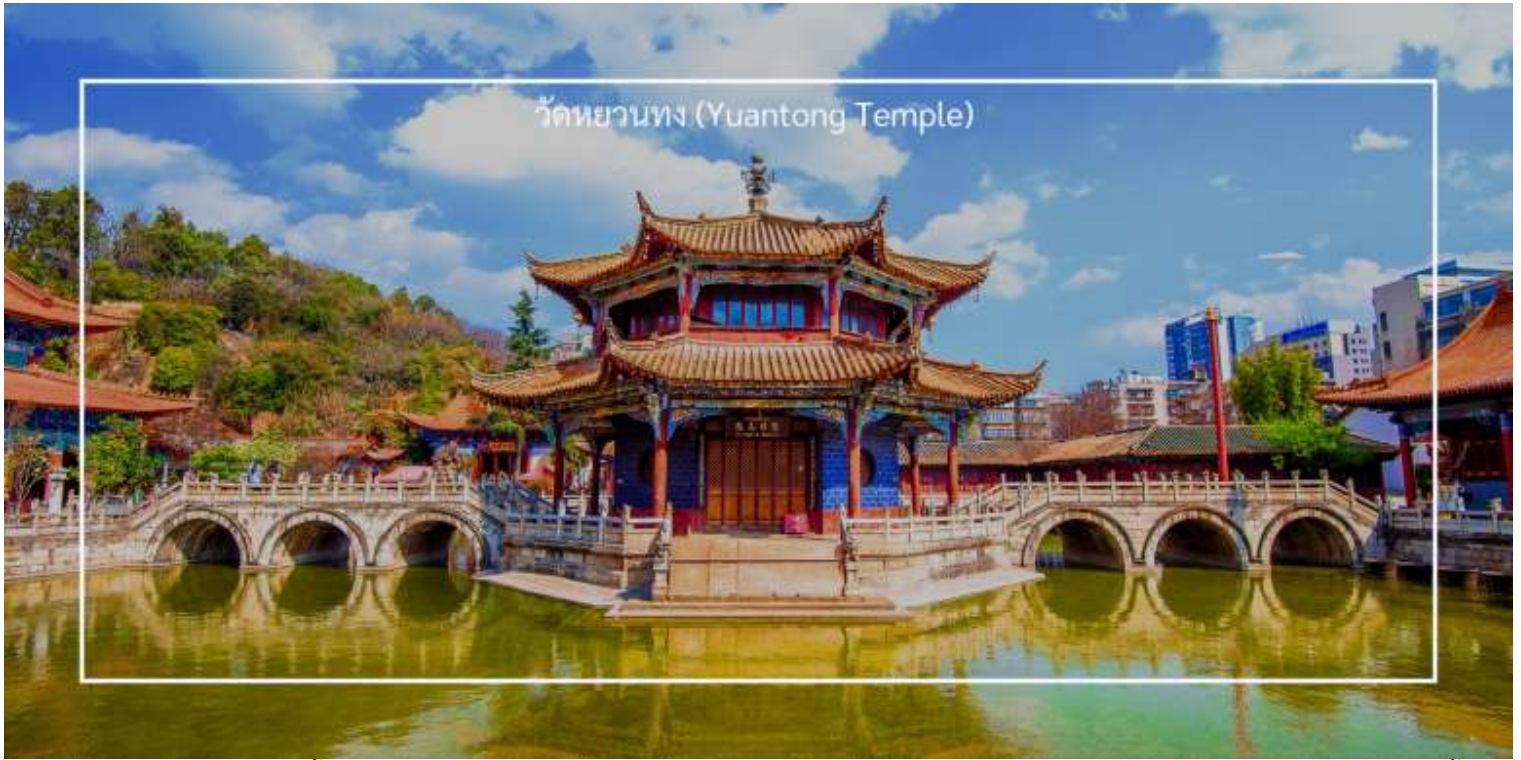
วัดหยวนทง (Yuantong Temple)

อิสระช้อปปิ้งถนนคนเดิน ประตูม้าทองไก่หยก (Golden Horse and Jade Rooster Street) เป็นแหล่งช้อปปิ้งที่มีชื่อเสียงในเมืองคุนหมิง (Kunming) สถานที่นี้เป็นที่นิยมของนักท่องเที่ยวและชาวเมืองสำหรับการช้อปปิ้ง สัมผัสวัฒนธรรมท้องถิ่น และลิ้มลองอาหารอร่อย ถนนคนเดินนี้มีร้านค้าหลายประเภท เช่น เสื้อผ้า ของที่ระลึก งานศิลปะ และของกินท้องถิ่น นักท่องเที่ยวสามารถเลือกซื้อสินค้าต่างๆ ได้ตามใจชอบ ถนนคนเดินนี้เต็มไปด้วยชีวิตชีวา มีการแสดงสด ดนตรี และกิจกรรมต่างๆ ที่ทำให้บรรยากาศน่าสนใจและน่าตื่นเต้น และยังมีร้าน POP MART ให้เหล่าสาวก ART TOY ให้เลือกซื้อคอลเลคชั่นแปลกใหม่ ที่อาจจะหาซื้อไม่ได้ในเมืองไทย