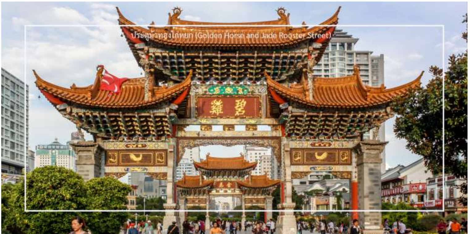
ประตูม้าทองไก่หยก (Golden Horse and Jade Rooster Street)

อิสระช้อปปิ้งถนนคนเดิน ประตูม้าทองไก่หยก (Golden Horse and Jade Rooster Street) เป็นแหล่งช้อปปิ้งที่มีชื่อเสียงในเมืองคุนหมิง (Kunming) สถานที่นี้เป็นที่นิยมของนักท่องเที่ยวและชาวเมืองสำหรับการช้อปปิ้ง สัมผัสวัฒนธรรมท้องถิ่น และลิ้มลองอาหารอร่อย ถนนคนเดินนี้มีร้านค้าหลายประเภท เช่น เสื้อผ้า ของที่ระลึก งานศิลปะ และของกินท้องถิ่น นักท่องเที่ยวสามารถเลือกซื้อสินค้าต่างๆ ได้ตามใจชอบ ถนนคนเดินนี้เต็มไปด้วยชีวิตชีวา มีการแสดงสด ดนตรี และกิจกรรมต่างๆ ที่ทำให้บรรยากาศน่าสนใจและน่าตื่นเต้น และยังมีร้าน POP MART ให้เหล่าสาวก ART TOY ให้เลือกซื้อคอลเลคชั่นแปลกใหม่ ที่อาจจะหาซื้อไม่ได้ในเมืองไทย