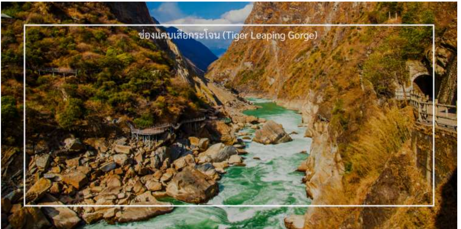
ช่องแคบเสือกระโจน (Tiger Leaping Gorge)

เที่ยวชม เมืองโบราณแชงกรีล่า (Shangri-La Ancient Town) เป็นสถานที่ท่องเที่ยวที่โดดเด่นในเมืองแชงกรีล่า ซึ่งตั้งอยู่ในมณฑลยูนนาน ประเทศจีน เมืองโบราณนี้มีความสำคัญทั้งในด้านประวัติศาสตร์และวัฒนธรรม เมืองโบราณมีบ้านเรือนที่สร้างขึ้นในสไตล์ทิเบตและชาวหนาน ซึ่งมีการตกแต่งที่สวยงามและมีเอกลักษณ์เฉพาะตัว เป็นศูนย์กลางวัฒนธรรมของชาวทิเบต มีตลาดที่ขายสินค้าท้องถิ่น เช่น เครื่องประดับแบบทิเบต ผ้าทอมือ และอาหารพื้นเมือง นักท่องเที่ยวสามารถเลือกซื้อของที่ระลึกและสัมผัสกับบรรยากาศของตลาดที่มีชีวิตชีวา เมืองโบราณตั้งอยู่ใกล้กับสถานที่ท่องเที่ยวสำคัญ เช่น วัดชงจ้านหลิง (Songzanlin Monastery) ซึ่งเป็นวัดที่สำคัญที่สุดในเขตนี้