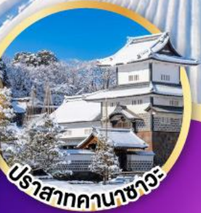
ปราสาทคานาซาวะ

ล่องเรือสำราญโซกาวะ ชมบรรยากาศหิมะและธรรมชาติ สวนเคนโระคุเอ็น 1 ใน 3 สวนที่งดงามที่สุดของญี่ปุ่น