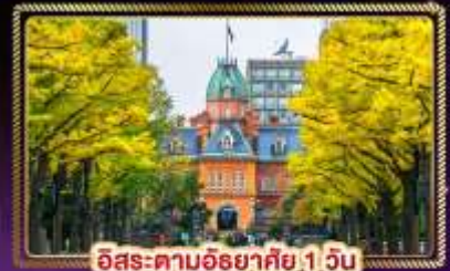
ฮิโระ-ตามฮิโรยามิ 1 วัน