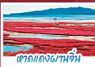
เขาดแดงผานจีน