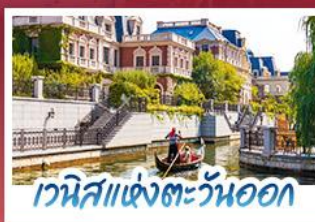
เวนิสแห่งตะวันออก