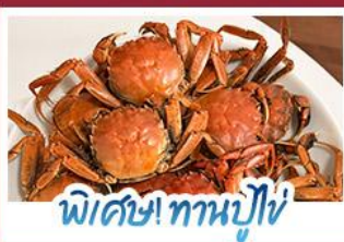
พิเศษ! ทานปูไข่

ปรากฏการณ์ธรรมชาติ 1 ปี มีแค่ครั้งเดียว! เตรียมชุดเก่งไปถ่ายรูปกับ 'หาดแดงผานจีน' ที่กำลังพรมสีแดงสดไปทั่วผืนน้ำ พร้อมฟินสุดขีดกับฤดูกาลทานปูไข่ที่คึกคักที่สุดแห่งปี • สัมผัสสวนสิริแห่งตะวันออกที่ตาเหลียน