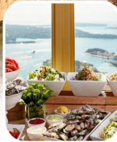
SKYFEAST BUFFET SYDNEY TOWER