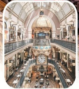
QUEEN VICTORIA BUILDING