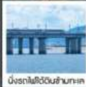
มังกรไฟใต้ดินซานทะเล