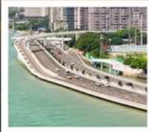
สะพานเหยียนหฺวู่เฉียว