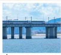
นั่งรถไฟใต้ดินข้ามทะเล