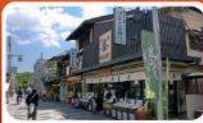
ช้อปปิ้งถนนสายชาเขียว