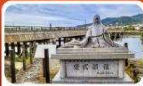
สะพานอูจิ