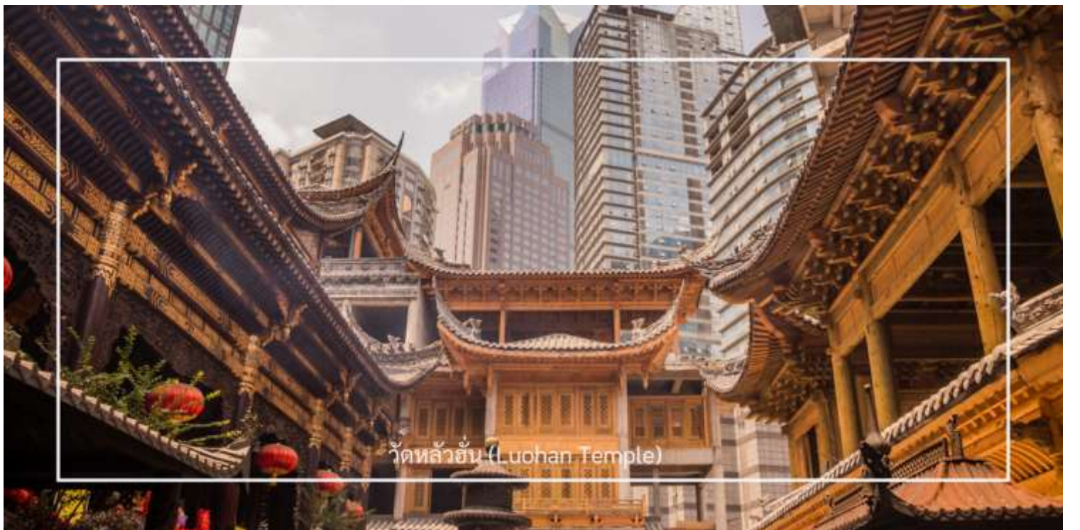
วัดหลัวฮั่น (Luohan Temple)

นำท่านเที่ยวชม วัดหลัวฮั่น (Luohan Temple) หรือที่เรียกว่า "วัดอรหันต์" เป็นวัดที่มีชื่อเสียงในเมืองฉงชิ่ง (Chongqing) มีประวัติศาสตร์ยาวนานและมีความสำคัญในด้านศาสนาพุทธ วัดหลัวฮั่นมีพระพุทธรูปและรูปปั้นอรหันต์จำนวนมาก ซึ่งเป็นที่เคารพนับถือของผู้มาเยือน นอกจากนี้ยังมีบริเวณที่ให้ผู้เข้าชมสามารถทำบุญและสวดมนต์