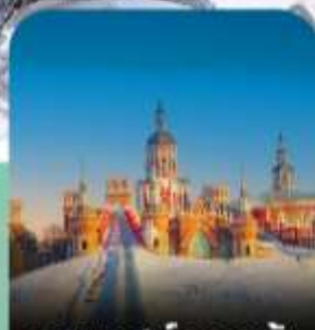
เทศกาลหิมะวอลกา