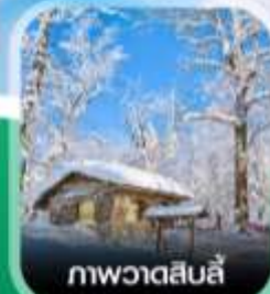
ภาพวาดหิมะสี