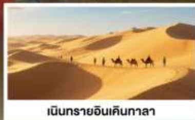
เป็นทรายอินเคินกาลา