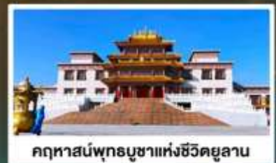
คฤหาสน์พุทธบูชาแห่งชีวิตยูลาน