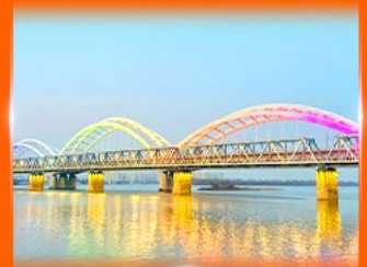
สะพานรถไฟปินโจว