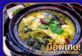
มีอพิเศ! ปลาต้มผักกาดดอง