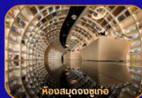
ห้างสมุดจงซูเก้อ