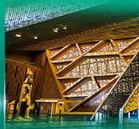
พิพิธภัณฑ์แกรนด์อียิปต์ (GEM)