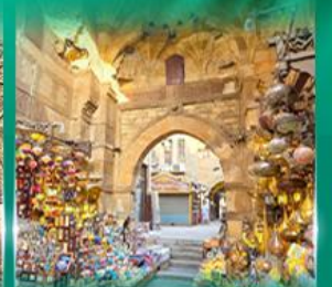
ตลาด่านเอลกาลลี