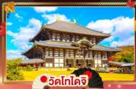
วัดโทโดจิ