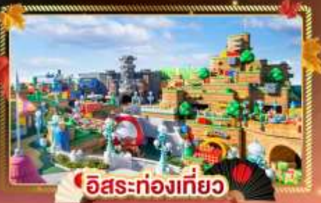
อิสระท่องเที่ยว