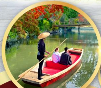
กิจกรรมล่องเรือยานากาวะ