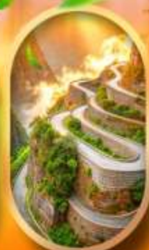
หุบเขาป้ายช้าง