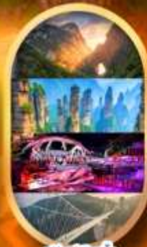
พรีเซ็นเลือกซื้อ Option เสริม