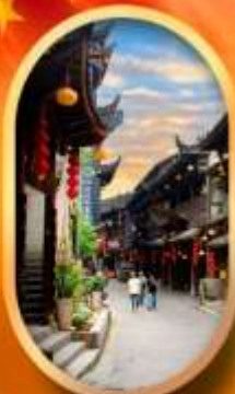
เมืองโบราณฟูหลงเจี้ยน