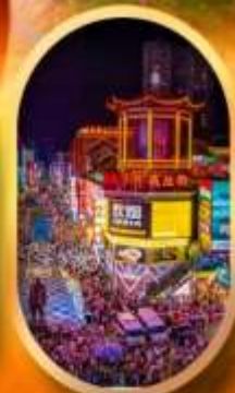
ถนนคนเดินซิงลู่