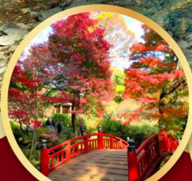
สวนดอกบ๊วยอาคางิ