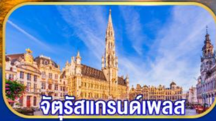
จัตุรัสแกรนด์เพลส