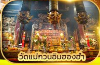
วัดแม่กวนอิมของฮ่า