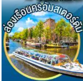
ล่องเรือนครอัมสเตอร์ดัม