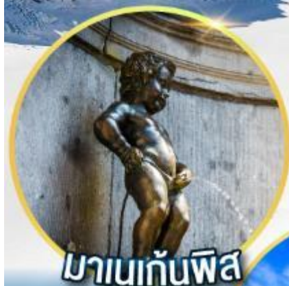
มานกันพิส