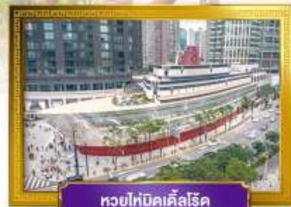
ทวยไห่บิคเคิลโรด