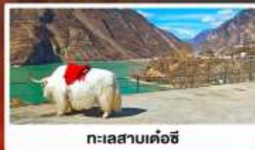
ทะเลสาบเค่อซี