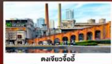
ตงเจียวจ้ออ๋