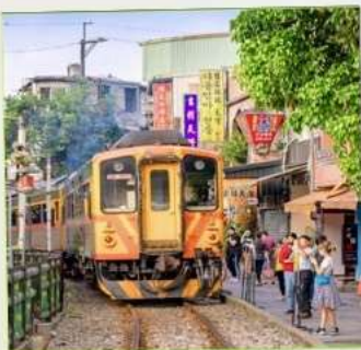
สถานีรถไฟสี้อเฟิ่น