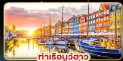
ท่าเรือบูธาว