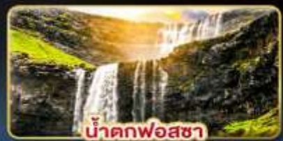
น้ำตกฟอสซา