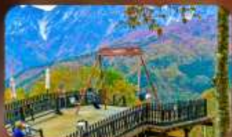
ฮาคุบะ-อิวาซากะ