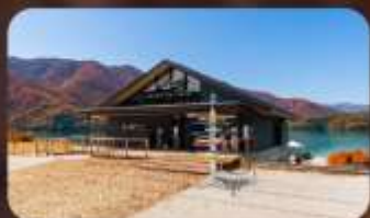
AO Lakeside Cafe 1