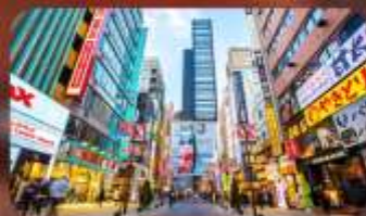
ซูปป์ิงชินจูกุ