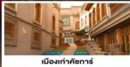
เมืองเก่าคัชการ์