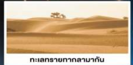
ทะเลทรายทากลามากัน