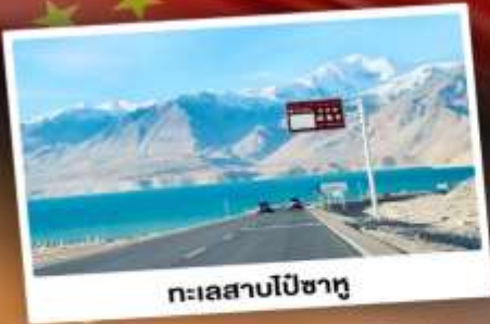
ทะเลสาบเปีซาตู

“ซินเจียงใต้” ดินแดนแห่งทะเลทราย สัมผัสวัฒนธรรมของชาวซินเจียงอุยกูร์