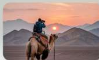
ทะเลทรายทากลามากัน