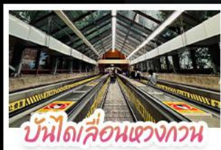
บันไดเลื่อนแขวงกวน