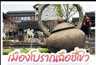
เมืองโบราณฉือชิว