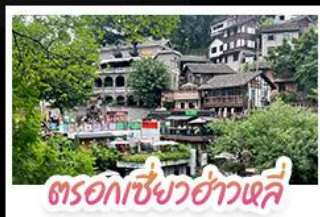
ตรอกเซียวฮ่าวเฉี