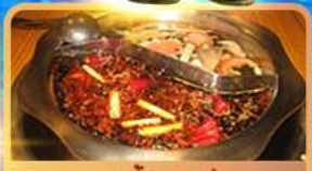
สุกี้ท้องถิ่น