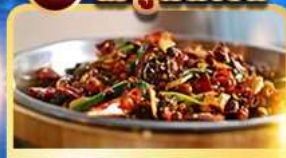
อาหารเสฉวน