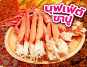
มิตรชุย เอ้าท์เล็ต พาร์ค คิชะระชู