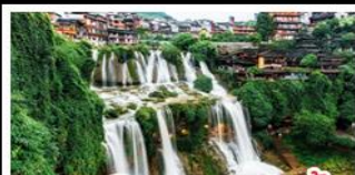
เมืองโบราณฝูเจียง