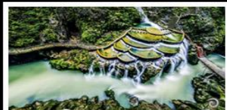
แกรนด์แคนยอนกวงเหิน

เขาฟ่านจิ่ง - เมืองโบราณฝูเจียง เมืองโบราณเฟิ่งหวง - เกาะส้มจิวโจว แกรนด์แคนยอนกวงเหิน - ไม้เข้าน้ำร้อน พักโรงแรม 5 ดาว - รถไฟความเร็วสูง