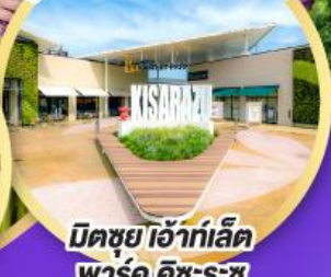
มิตซูเอะอิเกะอิ พาร์ค คิชะระชู