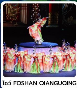
โชว์ FOSHAN QIANGUQING