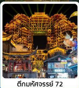
ตีทมหัดจรรย 72