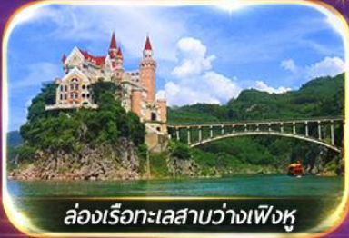
ล่องเรือทะเลสาบว่างเฟิงหู