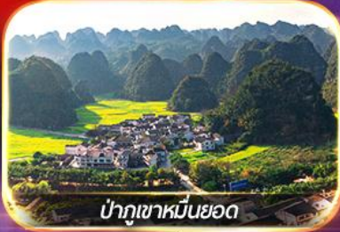
ป่าภูเขาหมื่นยอด