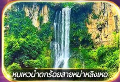
หุบเขาน้ำตกร้อยสายหม่าหลิงเหอ

ชมวิถีชีวิตหมู่บ้านปู้อี้ยามค่ำคืน, ล่องเรือทะเลสาบว่างเฟิงหู ชมสวนดอกไม้ตามฤดูกาล, ซุปบึงจู่ใจถนนคนเดิน