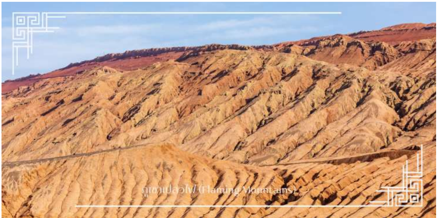
ภูเขาเปลวไฟ (Flaming Mountains)