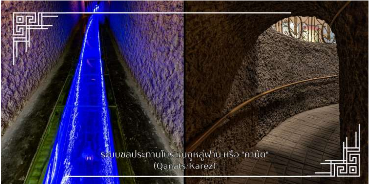
ระบบชลประทานโบราณคูหลู่ฟาน หรือ "คานัต" (Qanats/Karez)

ระบบชลประทานโบราณคูหลู่ฟาน หรือ “คานัต” เป็นระบบส่งน้ำใต้ดิน ในเขตซินเจียง ประเทศจีน ใช้ภูมิปัญญาชุดอุโมงค์ ใต้ดินเชื่อมต่อกัน เพื่อนำน้ำจากหิมะละลายบนภูเขามาใช้ในโอเอซิสทะเลทราย ลดการระเหยของน้ำ ทำให้เมืองคูหลู่ฟาน อุดมสมบูรณ์และเป็นแหล่งปลูกองุ่นขึ้นชื่อ