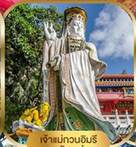
เจ้าแม่กวนอิม พลัสสมัย