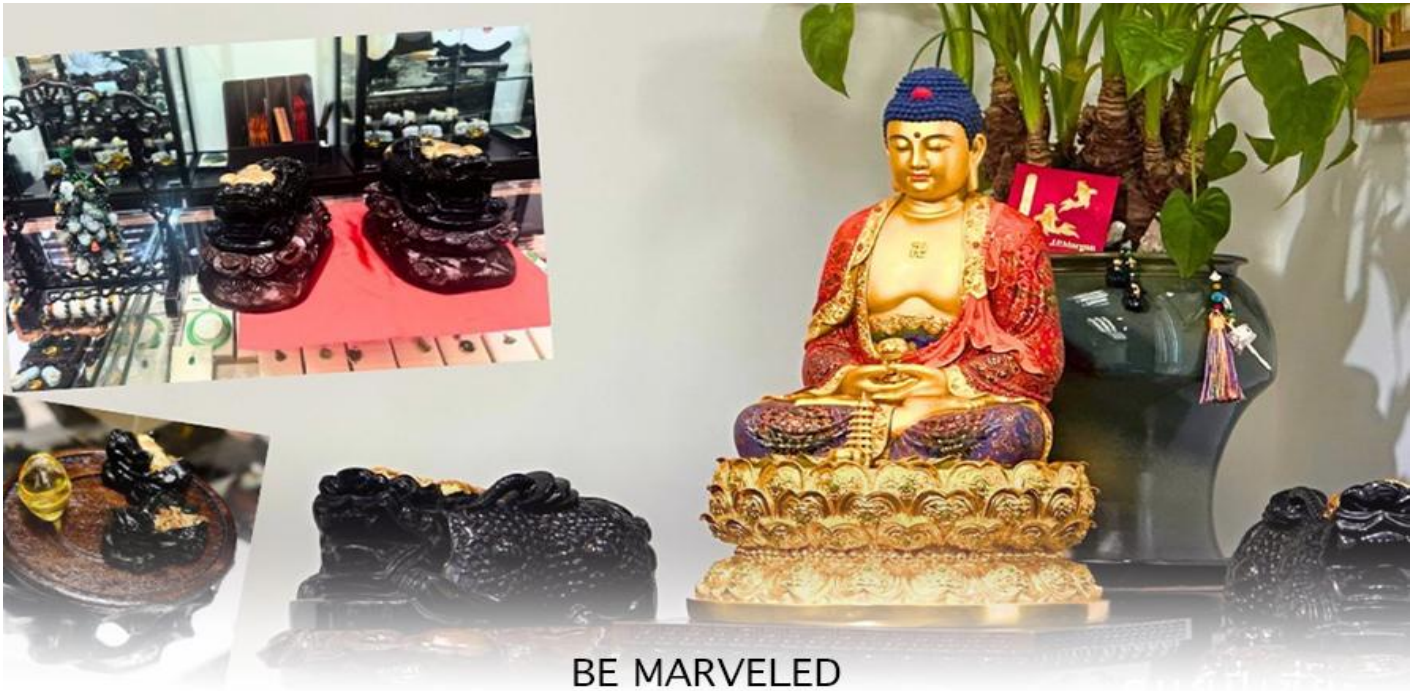
BE MARVELED ศูนย์บีเซี่ยะ

และนำท่าน ชม ศูนย์บีเซี่ยะ ซึ่งคนจีนนั้น ถือว่าหยกเป็นหิน ที่เป็นตัวแทนของความสวยงามและความบริสุทธิ์มีความเชื่อว่า หยก มงคล ถ้าพกติดตัวไว้จะอายุยืนและสุขภาพดีมีสินค้าน่ามากมายเกี่ยวกับหยก อาทิ กำไลหยก หรือสัตว์นำโชคอย่างบีเซี่ยะ ให้ ท่านได้เลือกซื้อเป็นของฝาก, ของที่ระลึก หรือของนำโชคแต่ตัวท่านเอง