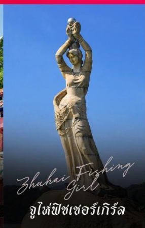
Zhuhai Fishing Girl จูไห่ฟิชเชอร์เก็ท