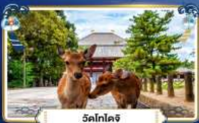
วัดโกไดจิ