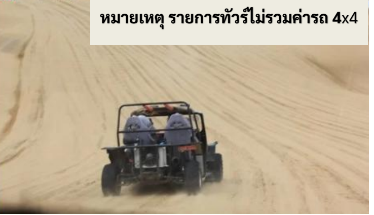
หมายเหตุ รายการทัวร์ไม่รวมค่ารถ 4x4

กลางวัน รับประทานอาหารกลางวัน ณ ภัตตาคาร (เมื่อที่ 8)